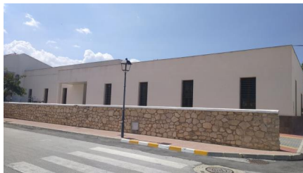
Fachada Principal Centro de Estancias Diurnas

Las actuaciones consistirán en: Instalación de Climatización e instalación de Sistema solar de circulación forzada para el servicio de agua caliente sanitaria (A.C.S.).