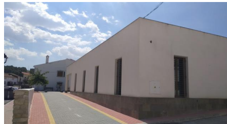
Fachada Principal Centro de Estancias Diurnas

El Centro de Estancias Diurnas se encuentra en la calle Mártires de Turón S/N, María, 04838 (Almería)